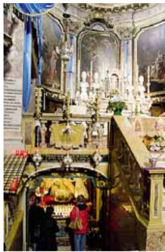
Desenzano, festa per l'apparizione della Madonna della Gamba

Ore 20,45, al Consultorio Scarpellini, via Conventino 8, nell'ambito del ciclo di incontri formativi e di